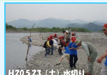
H20.5.23 (土) 水切り

お手伝い可能な方は、事務局へご連絡ください。詳細が決り次第ご連絡します。 なお、11月まで月1回、土曜日に活動スケジュールを立てておりますが、今後のスケジュールは、ただ今調整中です…第3土曜日が第4土曜日に、活動予定です。 お手伝い可能な方は、事務局へ活動についてお問い合わせください。