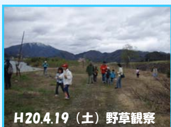
H20.4.19 (土) 野草観察

※ お手伝い出来る方は、事務局までご連絡ください。活動時間や場所の変更がある場合につきましては、事前連絡いただいた方のみにご連絡します。